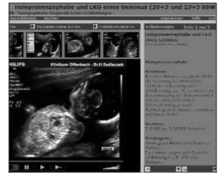
Abb. 2: Oberfläche „Sonographische Diagnostik fetaler Fehlbildungen“, hier: Real-Time-Modul

eller und didaktischer Qualität bilden in Zusammenhang mit wissenschaftlichen Begleittexten, sowie über 200 ausgewählten, interaktiven Standbildern und einem Fragenbereich zur Selbstkontrolle eine ideale Grundlage zur Ultraschall-Fortbildung am heimischen PC. Die Systemvoraussetzungen entspre-