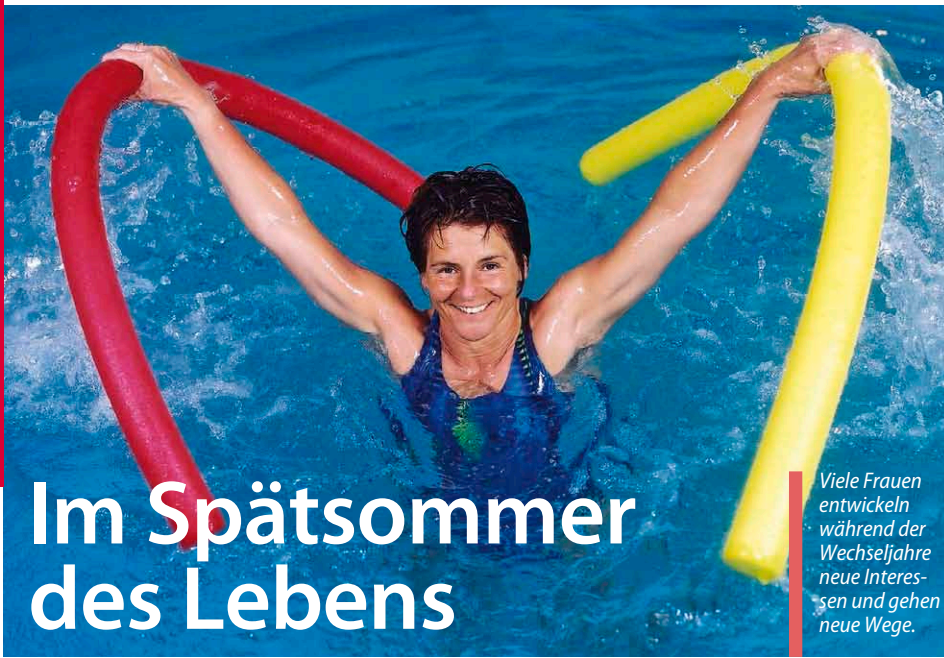
Viele Frauen entwickeln während der Wechseljahre neue Interessen und gehen neue Wege.